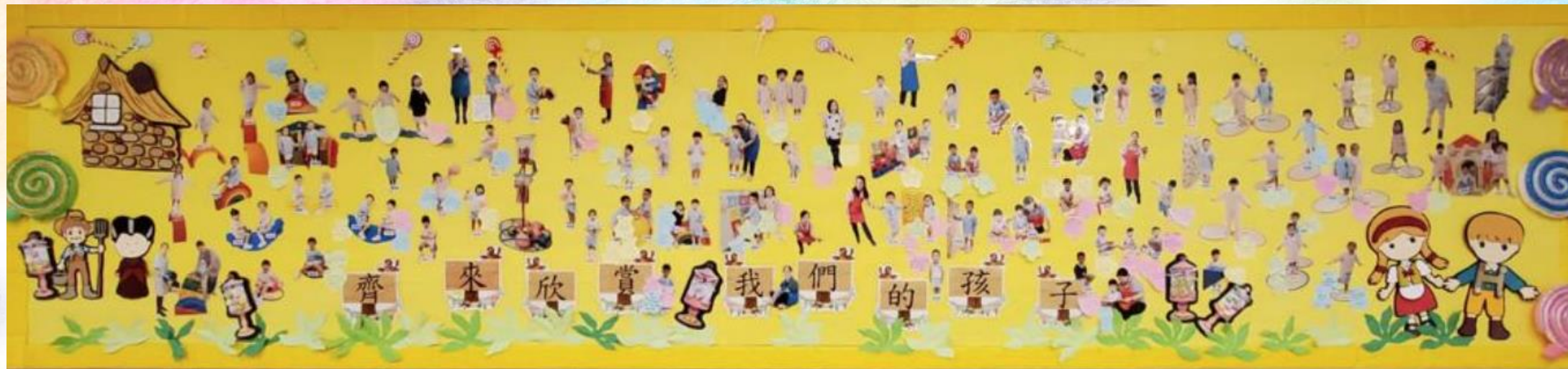
「齊欣賞我們的孩子」壁報